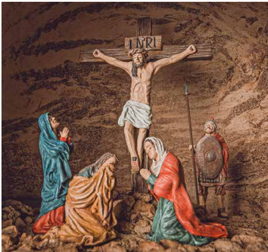
12. Station des Seehamer Kreuzweges

Dem Ansatz des EU Förderprogramms LEADER folgend,